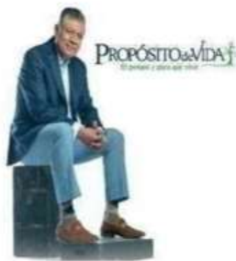
10 Propositi del Docente/Tutor come guida, consigliere e mentore degli studenti

Di seguito viene presentata un'immagine con le informazioni precedentemente indicate.